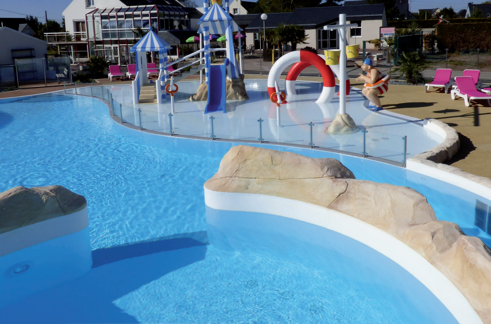
SÉPARATION PATAUGEOIRE inox et verre SECURIT